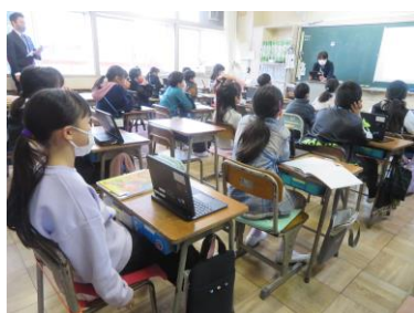
先生の説明を聞くとときは、タブレットの画面を黒板に向け、集中しやすい環境を作っていました。

ICT機器の便利な使い方を各校が市内小中学校にどんどん発信していければ、市内全体のICT活用能力が高まっていくと思います。「こんなみんな知っているだろうから」ではなく「こんな感じで使っています」くらいの気持ちで紹介していくのはいかがでしょうか。C4thという便利なシステムもあります。ICTプロジェクトリーダーの皆さん、ご検討ください!