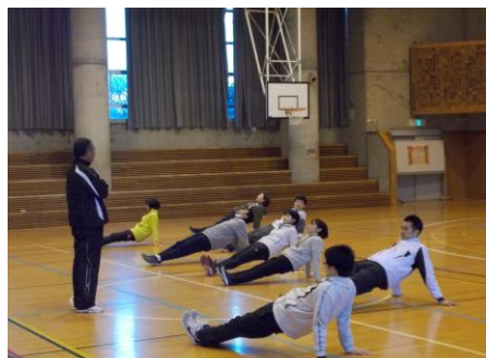
子どもたちを指導するために研修を積む先生方に感謝いたします。