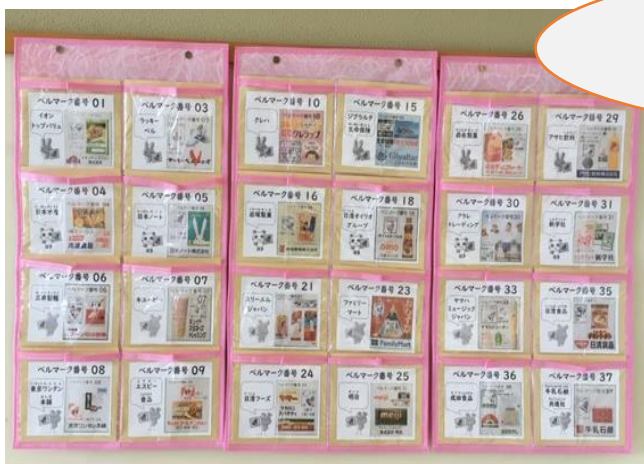
第二校舎二階 渡り廊下