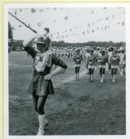
昭和51年 運動会は校舎裏の仮運動場で行われました。