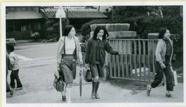
この校門を覚えている保護者の方も多いと思います。