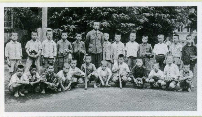
昭和23年 校舎前で撮影した野球チームの写真です。グローブを持っている児童はわずかです。