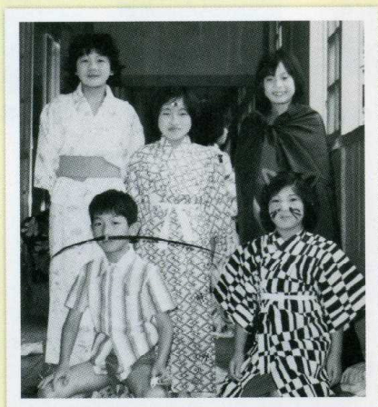
この当時（昭和54年7月）から、白一小ではお化け屋敷が大人気だったようです。