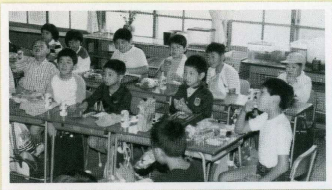
昭和54年4月より、センター方式の給食が開始されました。