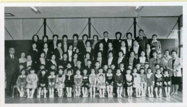
昭和51年 児童数が急増し、入学式の記念撮影はプレハブ校舎内で行われました。