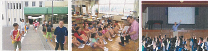
あいさつ運動 読書活動 (読み聞かせ) 清掃集会