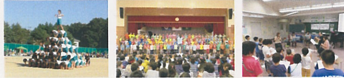
運動会 歌声集会 文化芸術鑑賞